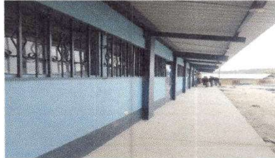
Foto 2: Sustitución y colocación de barcones en frente y atrás de la escuela