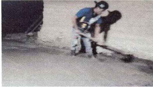
Foto1: Sustitución de piso de tierra por torta de concreto.